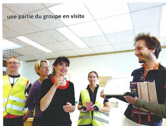
une partie du groupe en visite